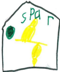
Esmee: We hebben in de spar gekookt.

Groep 2 vertelt erover in deze nieuwsbrief: