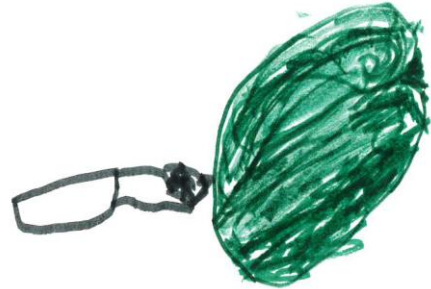
Bjorn: We hebben ook nog een kiwi gesneden