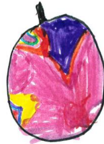
Chloe: En een appel